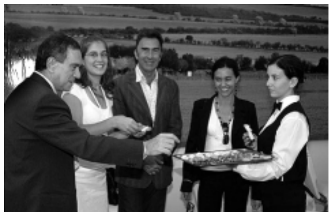
El agasajo a la prensa e invitados fue con carnes silvestres, preparadas con el toque maestro del chef de «Las Viñas».