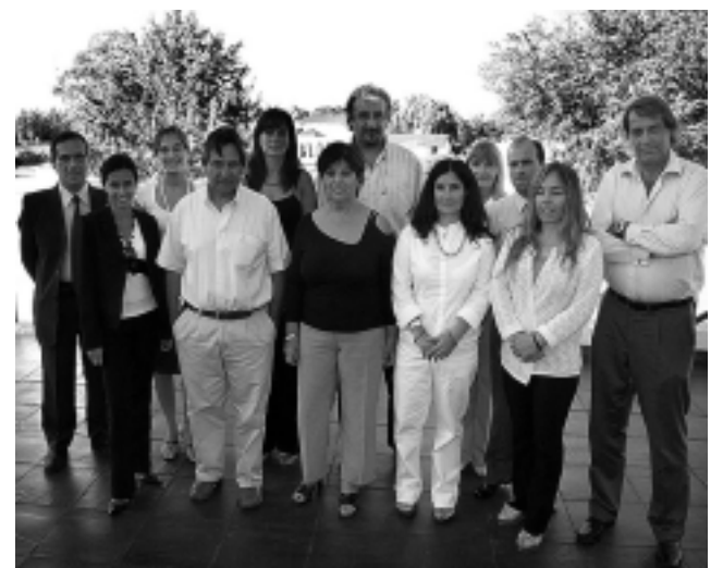
Integrantes del Ente Regional Patagonia Turística y colaboradores, durante un receso de la Sesión Ordinaria desarrollada en el Hotel Club La Campiña de Santa Rosa.