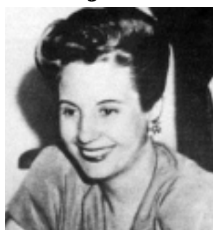
El derecho al voto en Argentina fue adquirido por una mujer, Eva Perón.

Es una fecha que por sus connotaciones históricas, debe ser reivindicada permanentemente. Es un momento para celebrar el papel de la mujer en todas las áreas del desarrollo humano que producen avances positivos, armonía social y posibilidad de mejoramiento general de las condiciones de vida de nuestra generación y de generaciones futuras.