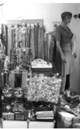
Pistacho Cool, local dedicado a la venta de indumentaria femenina, está ubicado en Raúl B. Díaz 336.