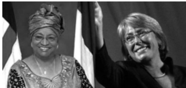
Hoy muchas mujeres están llegando a ocupar las posiciones más encumbradas de la vida pública, en puestos que históricamente pertenecieron a los hombres.

Pero hoy, muchas mujeres van por más y el ámbito de la política es un claro ejemplo, cuando están llegando a ocupar las posiciones más encumbradas de la vida pública, en puestos que históricamente pertenecieron a los hombres.