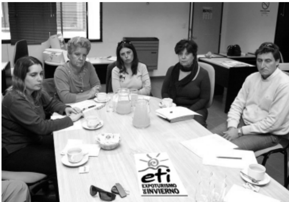
Una de las mayores preocupaciones de todos los involucrados con la ETI 2007, tanto del área pública como privada, es la coincidencia de fechas a nivel local con la Expo PyMe que organiza el gobierno de La Pampa. No obstante la difusión turística estará en ambos lados.

Allí se definieron pautas de los productos turísticos a publicitar de acuerdo a la época del año y las imágenes que acompañarán los mismos en