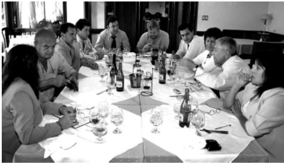
Durante la reunión se definió no hacer la ronda de negocios de ETI por no haber podido acordar con los responsables organizadores. Lo que si se concretará, de acuerdo a lo decidido en La Pampa, es el Centro de Negocios organizado por la empresa editorial LADEVI, por una gestión que ha iniciado Ferias Argentinas.

Uno de los puntos tratados en Santa Rosa fue sobre la Exposición de Turismo de Invierno, donde Castracane informó