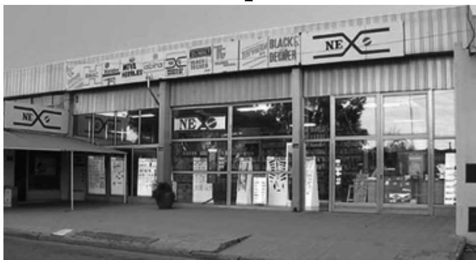
En Nexo Herrajes y Cerrajería se puede encontrar todo tipo de herrajes para el hogar, comercio, industria, oficina, etc. y desde el año pasado anexaron el servicio de cerrajería que ha tenido una muy buena aceptación.

Esta empresa ubicada en Avda. Luro 1691 se dedica al polarizado de cristales en vehículos. También venden las láminas para polarizar, hacen grabados de cristales, colocación de alarmas, gráfica autoadhesiva, tratamientos de teflón, laminados de seguridad, etc. Los polarizados tie-