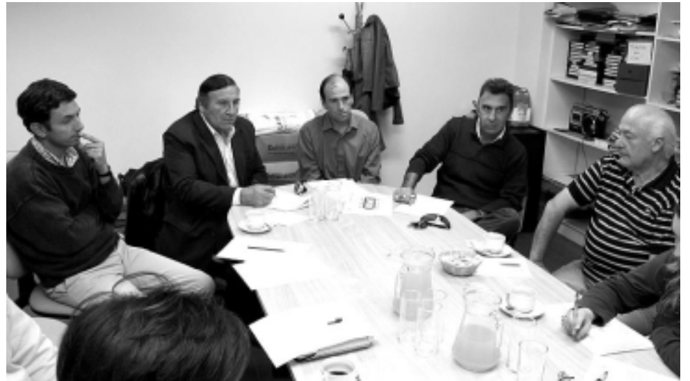
Las instituciones relacionadas a la actividad turística provincial estarán presentes, junto con prestadores de servicios. Además de los destinos invernales tradicionales, muchas familias buscan nuevas opciones en paisaje y servicios. Ahí es donde La Pampa tiene que ofrecer lo suyo y saber aprovechar esta fecha estacional que genera un gran movimiento de viajeros.

El stand del Ente Regional Oficial de Turismo «Patagonia Turística», donde estará La Pampa, se encuentra en una ubicación privilegiada, al ingreso de la muestra. En el acceso al stand, se obsequiarán mapas de la región donde se pueden visualizar todas las actividades