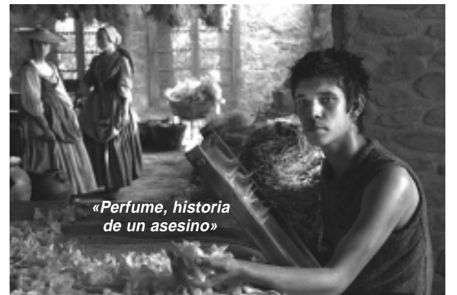
«Perfume, historia de un asesino»

«Arthur y los Minimoys»: Arthur empieza a leer con más detalle un libro mágico antiguo que pertenecía a su abuelo y se da cuenta que hay numerosas pistas sobre un tesoro escondido en su casa y que aparentemente hay una vida invisible debajo de la tierra, un mundo habitado por criaturas diminutas, que se llaman Minimoys. Aventura animada. ATP.