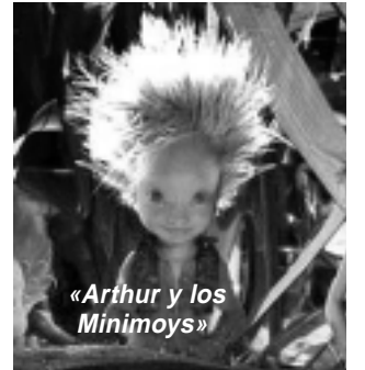
«Arthur y los Minimoys»

«Arthur y los Minimoys»: Arthur empieza a leer con más detalle un libro mágico antiguo que pertenecía a su abuelo y se da cuenta que hay numerosas pistas sobre un tesoro escondido en su casa y que aparentemente hay una vida invisible debajo de la tierra, un mundo habitado por criaturas diminutas, que se llaman Minimoys. Aventura animada. ATP.