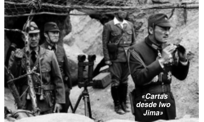
«Cartas desde Iwo Jima»