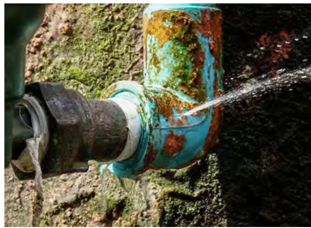
Según datos de Amanco Wavin el 30% del agua segura de todo el mundo se pierde debido a fugas en las tuberías y en Argentina ese número asciende al 40%.

Grandes inundaciones y sequías con escasez de agua se ven cada vez con