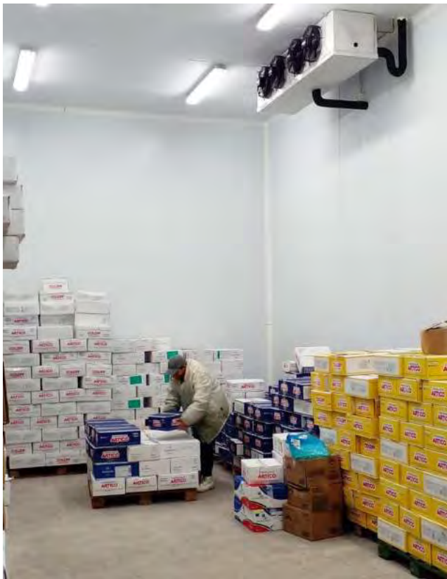
La planta fabril de PICOMAR Distribuidora en el Parque Agroalimentario de General Pico, cuenta con una cámara frigorífica de 55 m2 y una altura de cinco metros.

La planta fabril de PICOMAR Distribuidora en el Parque Agroalimentario de General Pico, cuenta con una cámara frigorífica de 55 m2 y una altura de cinco metros,