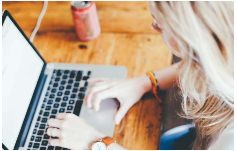
En ese marco y según un estudio realizado, 4 de cada 10 personas a nivel global están interesadas en vivir unas vacaciones con trabajo.

Con el objetivo de facilitar esta tendencia y apoyar a los nómades digitales, Booking.com, la plataforma de reservas de alojamientos y otros lugares únicos para hospedarse, alquiler de autos y atracciones presenta cinco destinos ideales en Argentina que combinan perfectamente el trabajo con la posibilidad de disfrutar de nuevas experiencias: